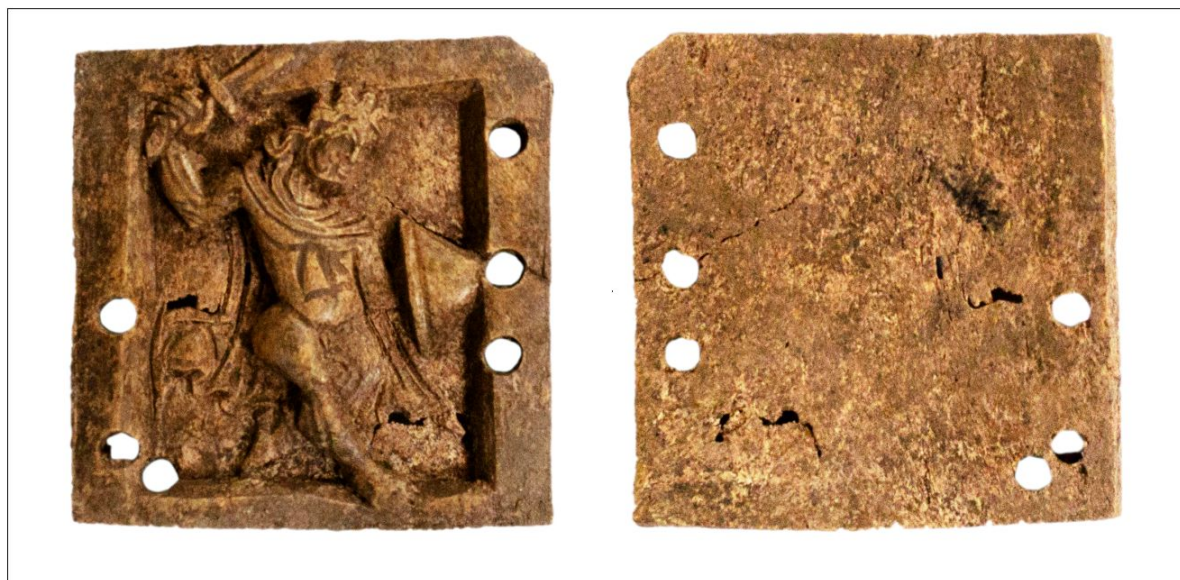
Костяная накладка с изображением воина